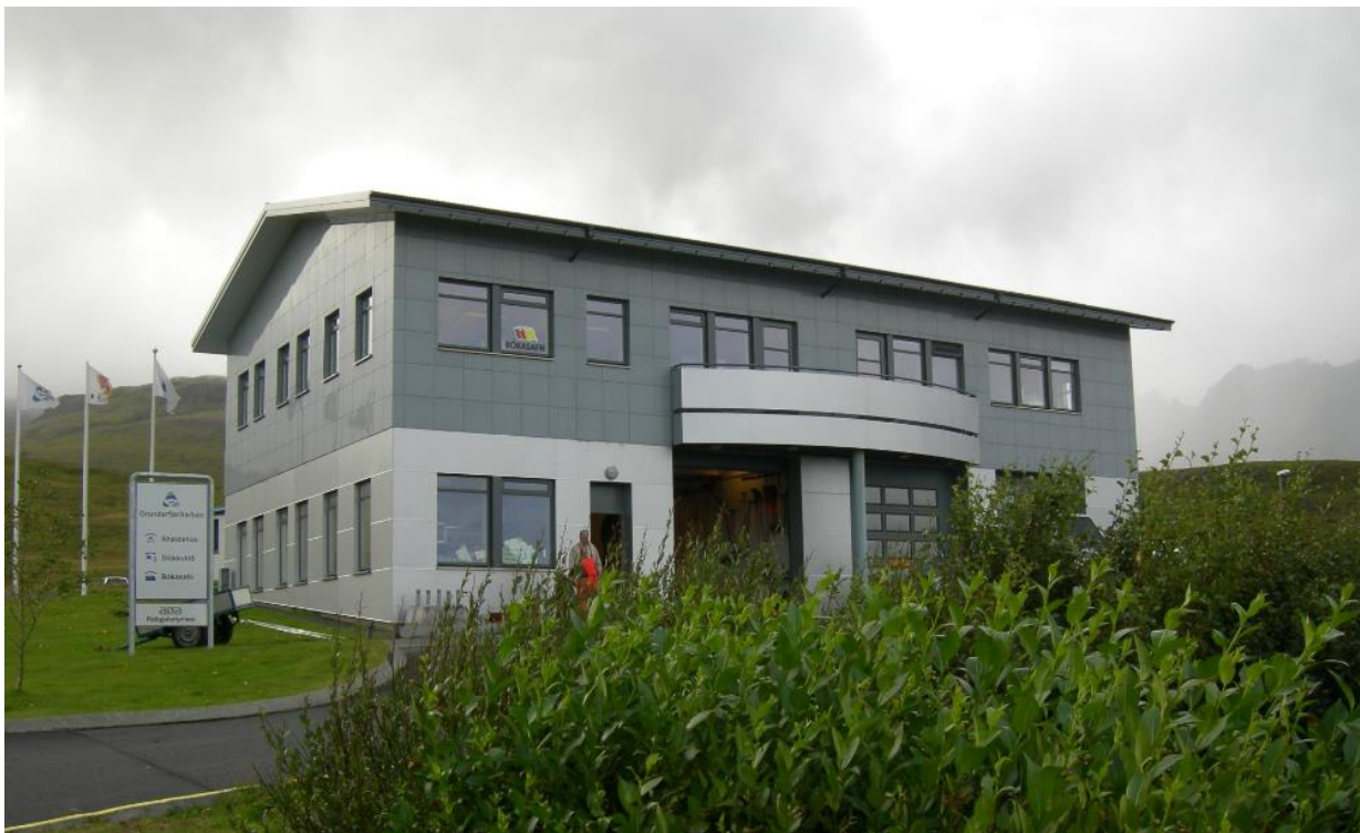
Smíðjan að Borgarbraut 16 var tekin í notkun í maí 2001.