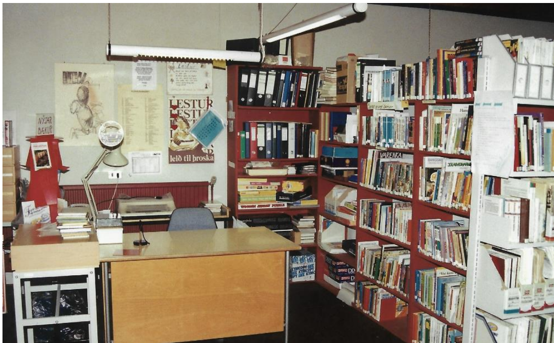
Bókasafnið eftir 1984.