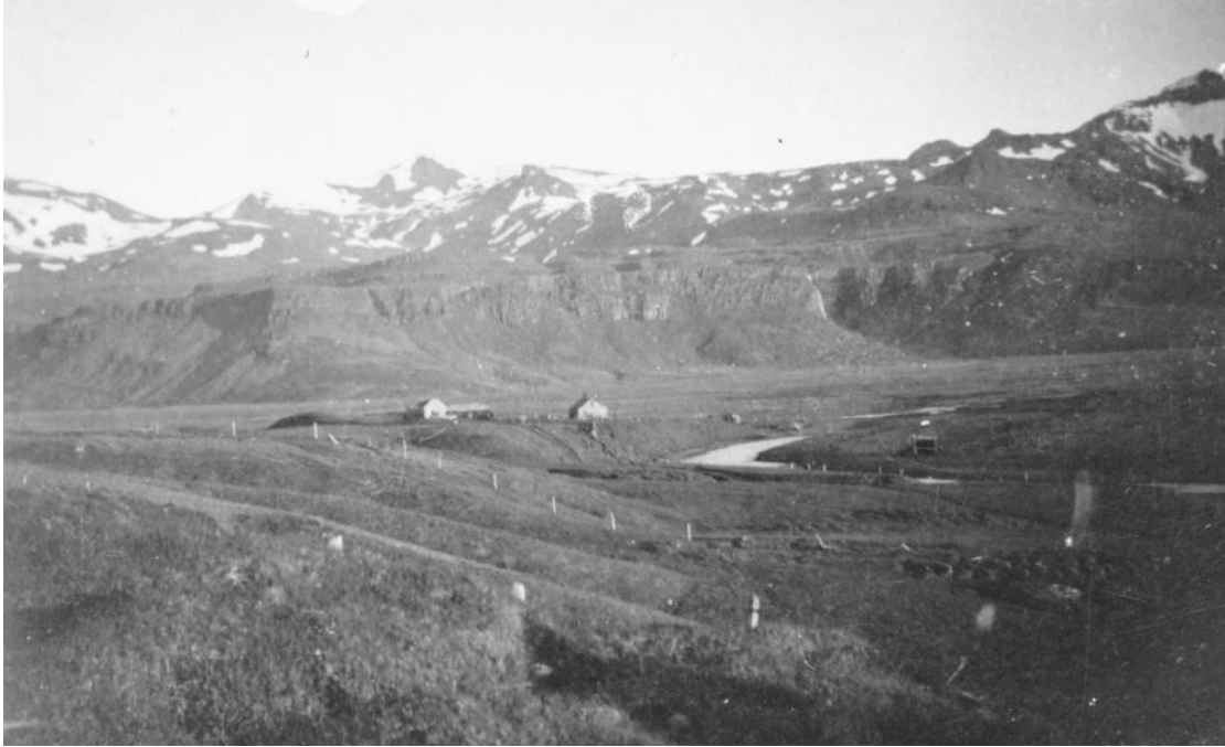
Grund um 1970.

Frá upphafi var bókakosturinn staðsettur á heimili þess sem sá um það hverju sinni.