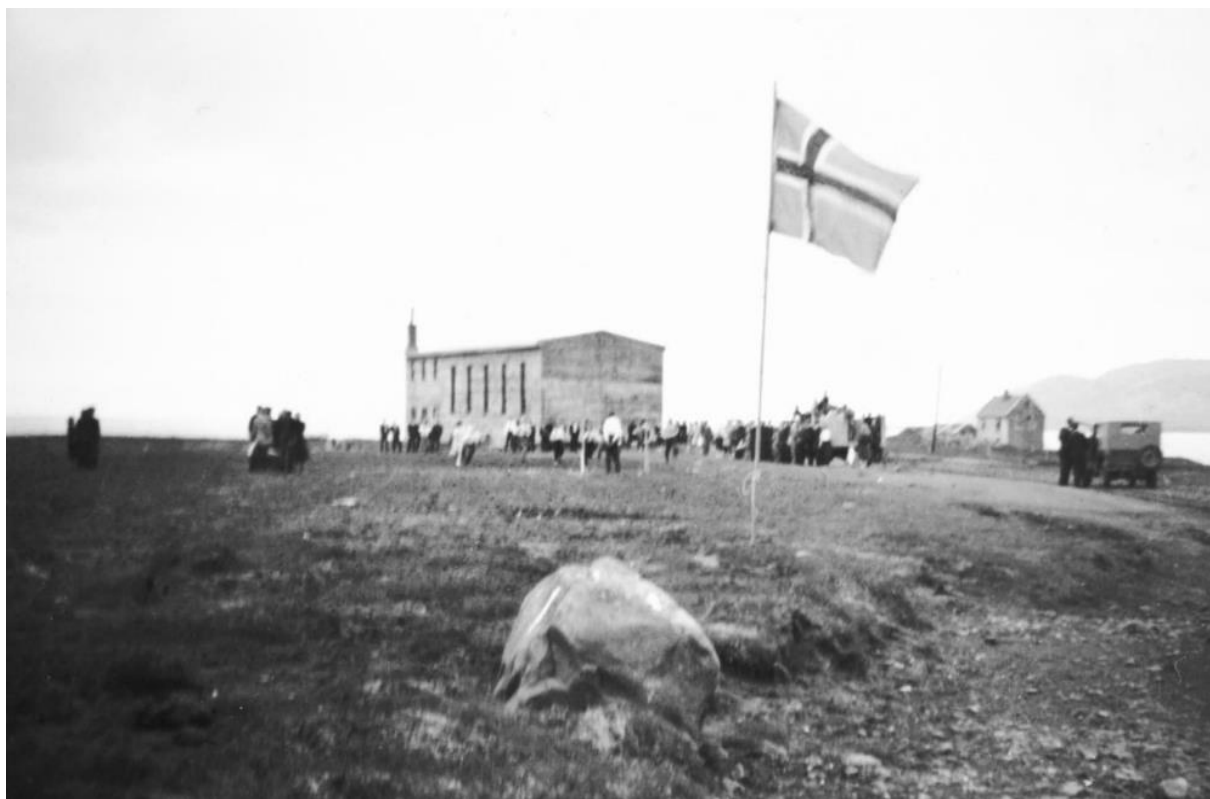
Samkomuhús Grundarfjarðar um 1946.

Í Eyrarsveit var farskóli eins og víðast í dreifðum byggðum landsins. Íbúar í plássunum kringum Grundarfjörð fluttu sig um set til stækkandi þéttbýlis í Grafarnesi og börnunum fjölgaði þar. Ungmennafélagið og Eyrarsveit urðu ásátt um að byggja Samkomuhús með aðstöðu fyrir skólahald og samkomusal með aðkomu Kvenfélagsins Gleym mér ei.