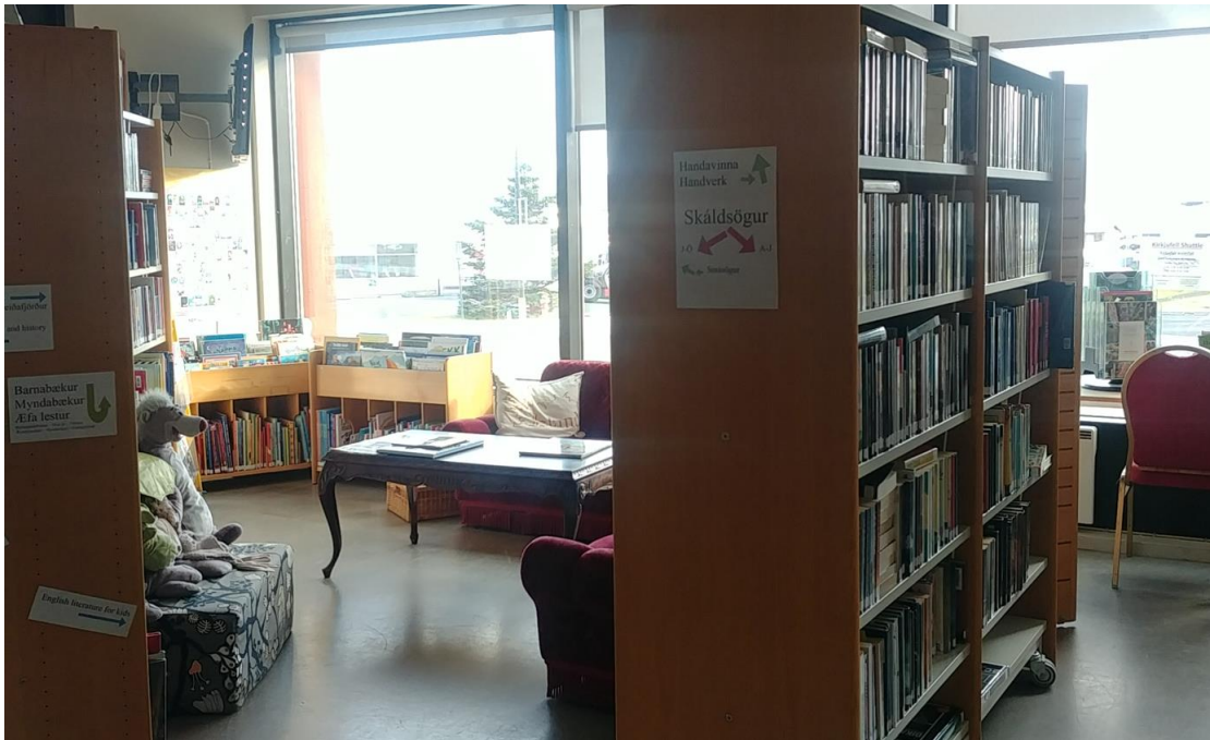
Barnaeildin t.v. Hluti af bókakosti safnsins er í vesturhluta Sögumiðstöðvar.

Á 100 ára afmælisári Bókasafns Grundarfjarðar væri kjörið að hugsa enn frekar hvernig bæta megi aðstöðu bókasafnsins og þjónustu þess við íbúana, þannig að þeir líti á safnið sem huggulegan viðkomustað á leið sinni um bæinn og ekki síst, að það laði að sér fjölskyldur með börnin sín.