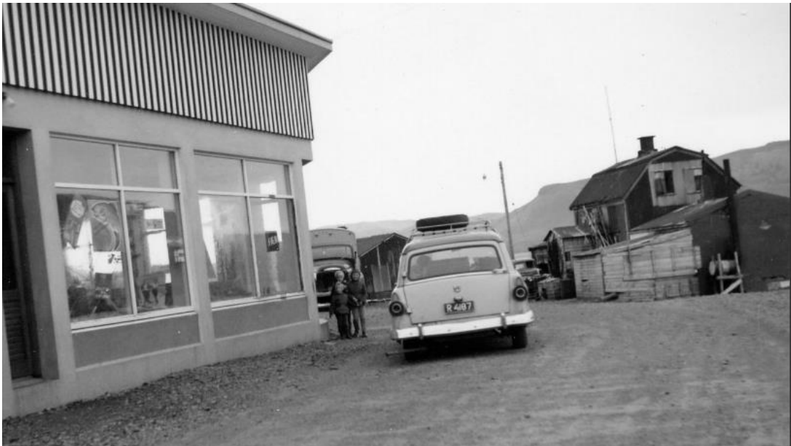
Kaupfélag Grundfirðinga og Neshúsin t.h. upp úr 1962.

Ungmennafélag Grundarfjarðar tók við því eftir stofnun þess en það var stofnað 1933.