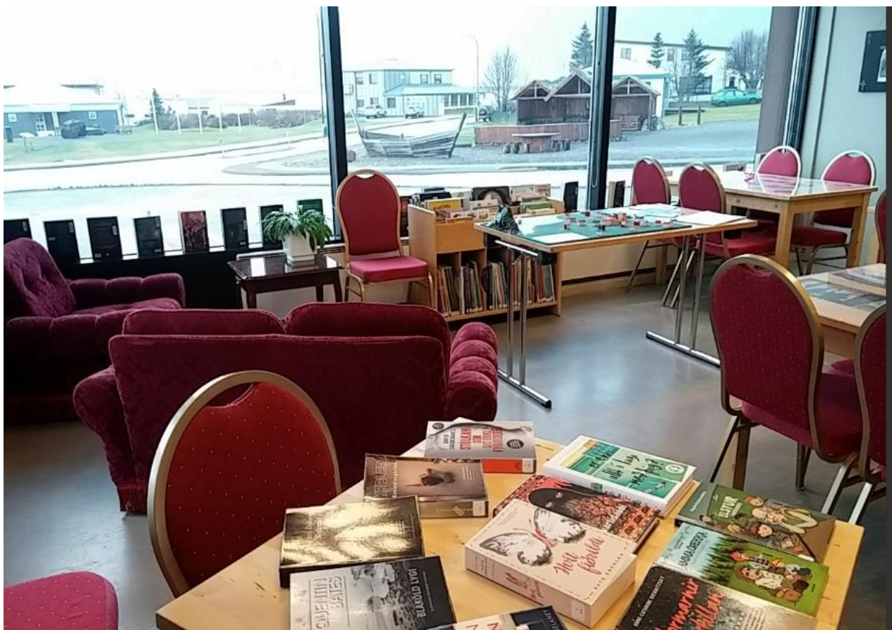
Staðsetning bókasafns í miðbæ leiðir alltaf til fleiri heimsóna íbúa.