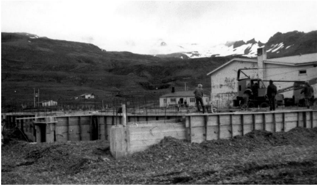
Grunnur að viðbyggingu barnaskólan sem tekin var í notkun 1978. Ljasm. BC.