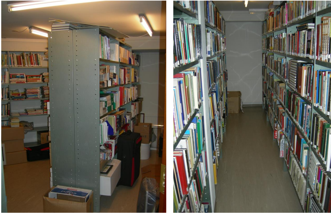
Geymslur bókasafnsins að Grundargötu 30.