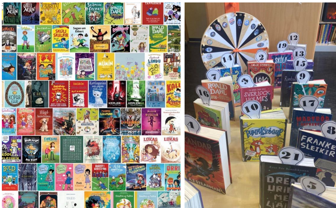
Bókaverðlaun barnanna – Veggspjald með árlegri kosningu. – Lestrarhjólið.

Sjá meira á https://www.facebook.com/grundobokasafn/ .