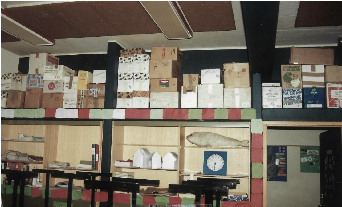
Á efri hillum í skólastofu fjölgaði sífellt kössum með geymslubókum.