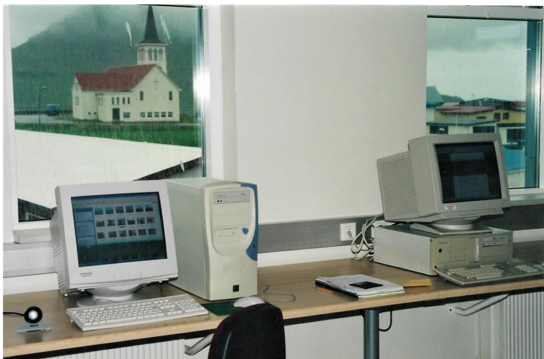
Aðstaða í dreifnámsverinu í Smiðjunni að Borgarbraut 16.

Ekki varð úr að safnið flytti aftur inn í grunnskólann vegna sívaxandi fjölgunar nemenda. Var ákveðið að byggja yfir gamla vélsmiðju Bærings Cecilssonar sem hann byggði á 7. áratugnum að Borgarbraut 16 og í lok maí 2001 flutti safnið inn á efri hæðina og Dreifnám Grundarfjarðar um haustið. Á neðri hæð er aðsetur Slökkviliðs Grundarfjarðar og áhaldahúss sveitarinnar. Nemendur sóttu dreifnámið þar til Fjölbrautaskóli Snæfellinga tók til starfa haustið 2004. Eldri borgarar tóku síðan við aðstöðunni fyrir sitt félagsstarf.