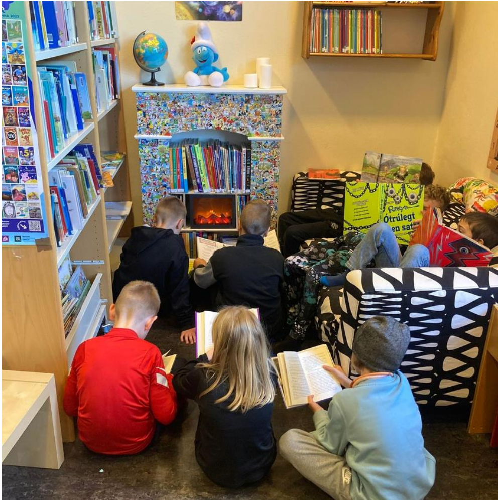
Kósíhorn á skólabókasafninu.