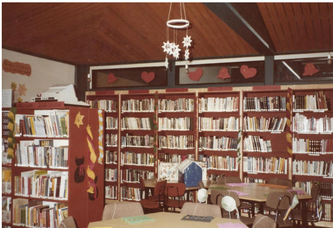
Jól í bókasafninu 1984 eða 1985.